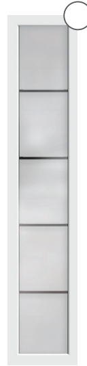
G-5004** mattiertes Glas mit 4 klaren Streifen***, waagerecht