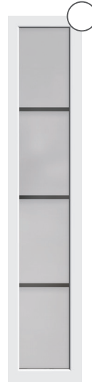
G-5003** mattiertes Glas mit 3 klaren Streifen***, waagerecht