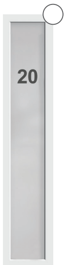
G-510 mattiertes Glas mit Haus- nummer