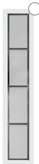
G-5003-25** mattiertes Glas mit klarem Rand und 3 klaren Streifen***, waagerecht