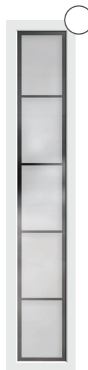
G-5004-25** mattiertes Glas mit klarem Rand und 4 klaren Streifen***, waagerecht