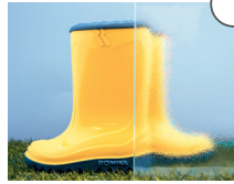
ORNAMENT 504 WEISS